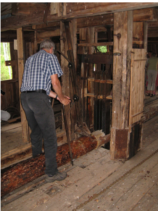
Foto 3. Stocken centreras.