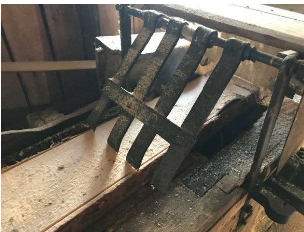
Foto 7. Plankan sågas. Plattstålen håller ner plankan.