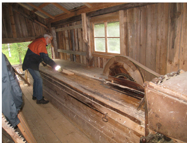
Foto 8. Färdigkantad bräda matas ut.