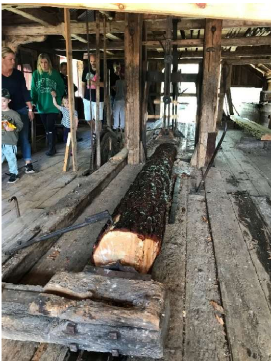
Foto 1. Stocken fäst mot sågsläden i rotänden.