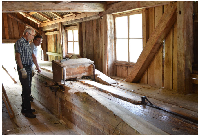
Foto 6. Plankan sågas. Bilden visar bl a påskjutningsklacken