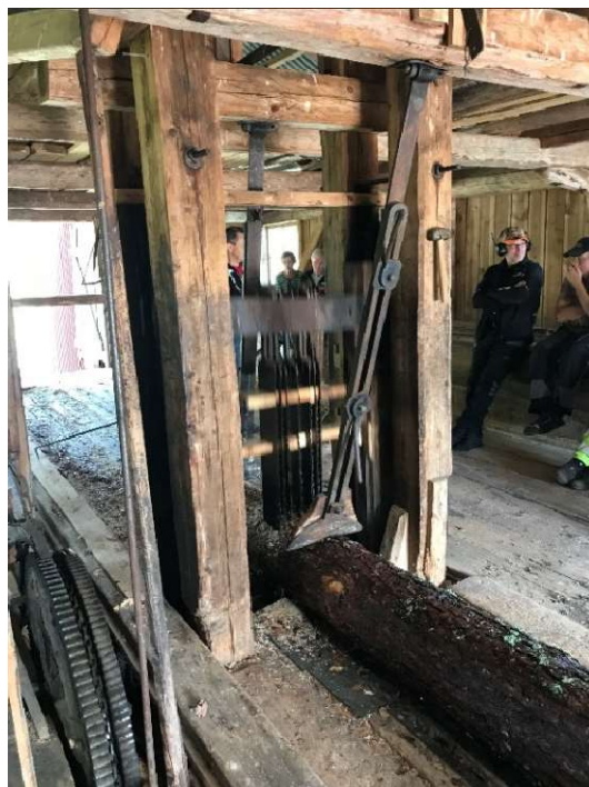
Foto 2. Stocken hålls ner av ställbart stöd, så att den inte åker med sågbladen upp.