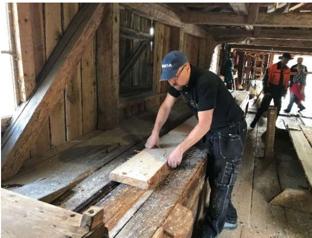
Foto 5. Plankan läggs rätt i sidled.