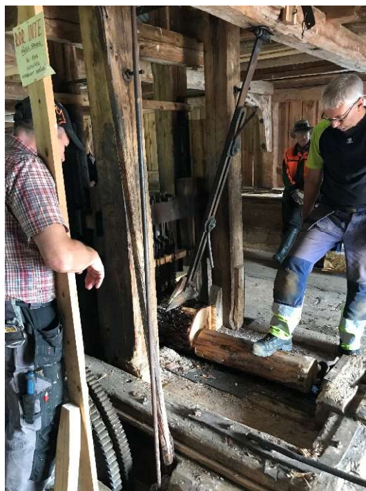
Foto 4. En liten stockbit används för att slutföra sågningen av den sista stocken.